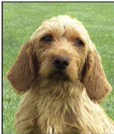
Korrekt ansatta öron.

Halsen skall vara kort, dock måste den vara av tillräcklig längd för spårfunktion.