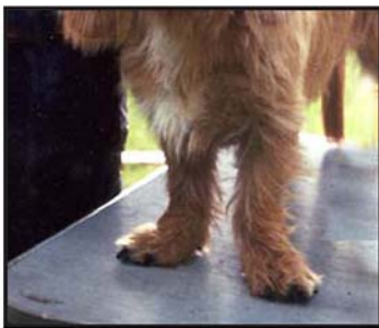
För fransysk front.